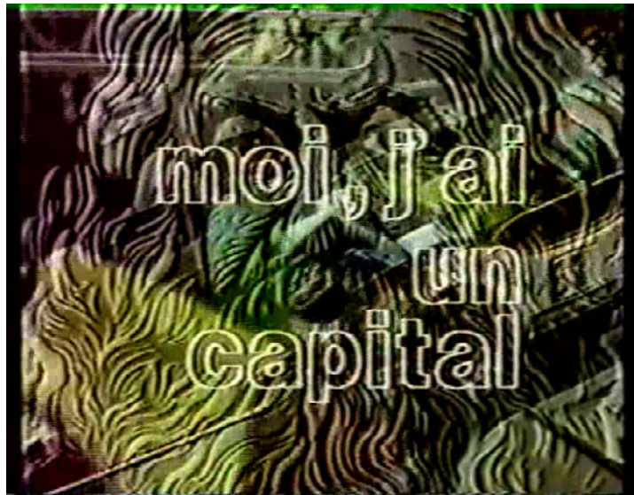
Film still uit Le Rapport Darty van Jean Luc Godard & Anne-Marie Miéville, 1989