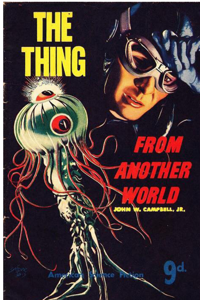
Act II Book cover of The Thing from Another World by John W. Campbell, 1938